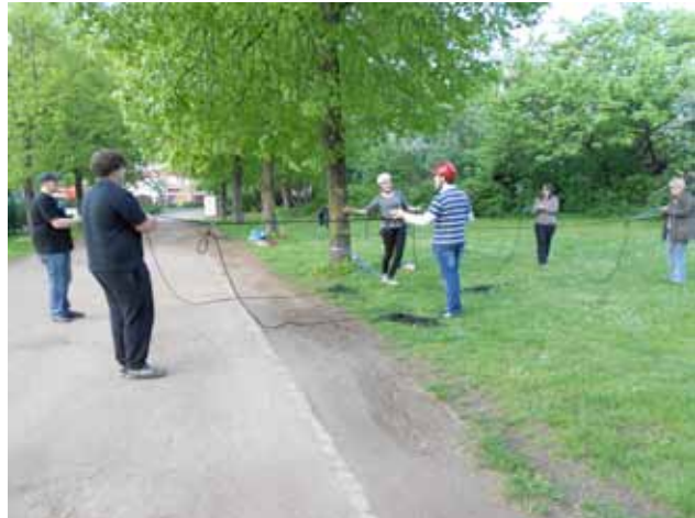
11 Teilnehmer – ein Tag – Fortsetzung folgt