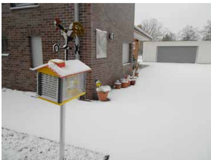
der erste Schnee