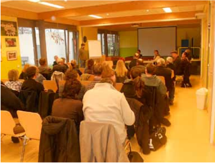
Dialogforum des Jugendamtes der Stadt Duisburg